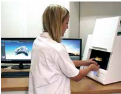
Gipsmodell im Scanner mit CAD/CAM-Bild