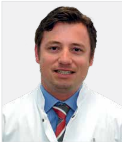
Direktor (Komm.) an der Poliklinik für Kieferorthopädie, Universität Jena

Im zunehmenden Alter kommt es zu physiologischen Veränderungen, die sich auch auf den Kontakt zwischen den Zähnen des Ober- und Unterkiefers (Okklusion) auswirken und die präventiv berücksichtigt werden sollten. Ein Beispiel ist der zunehmende Frontengstand im Unterkiefer – als Folge davon, dass der Gesichtsschädel die Form verändert.