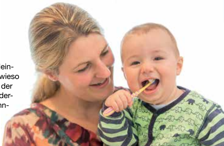
Der spielerische Einstieg in die Zahnpflege

Es ist ein Ammenmärchen, dass Milchzähne bei Babys und Kleinkindern nicht so gut gepflegt werden müssten, weil sie ja sowieso ausfallen. Experten sind sich einig, dass auch die Zähnchen der Kleinen täglich gereinigt werden sollten – am besten mit einer Kinderzahnbürste mit weichen Borsten und etwas fluoridierter Kinderzahn-pasta. Am einfachsten gelingt das, wenn das Kind bereits früh durch feste Rituale ans Zähneputzen gewöhnt wird. In den ersten Lebensjahren putzen Vater oder Mutter. Spätestens ab dem dritten Lebensjahr wird empfohlen, das Kind selbst die Pflege übernehmen zu lassen – nach intensivem Üben unter Aufsicht natürlich, denn so einfach ist die gründliche Pflege für das Kind nicht. Hier unterstützen Bilderbücher und CDs mit Zahnputzliedern. Darüber hinaus empfehlen Zahnärzte, dass Eltern den Putzerfolg bis in die Schulzeit hinein kontrollieren und – wenn nötig – nachputzen.